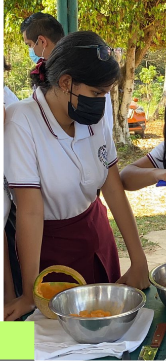
PROGRAMA DE MEJORA REGULATORIA 2023